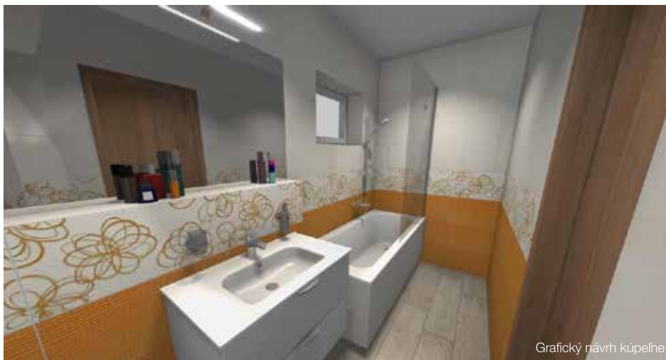
Grafický návrh kúpeľne

Koncom minulého roka sa v Poprade konal už piaty ročník charitatívneho večera Fashion Charity Night 2018 . Jeho cieľom je vyzbierať čo najväčší výťažok na dobročinné účely. Príspevky od partnerov, ktorí event podporujú, putujú každý rok na pomoc vybraným rodinám, ktoré sa nachádzajú v ťažkej životnej situácii. Jedným z partnerov podujatia bola aj spoločnosť Aquaterm, ktorá je predajcom kúpeľňového vybavenia. „Boli sme