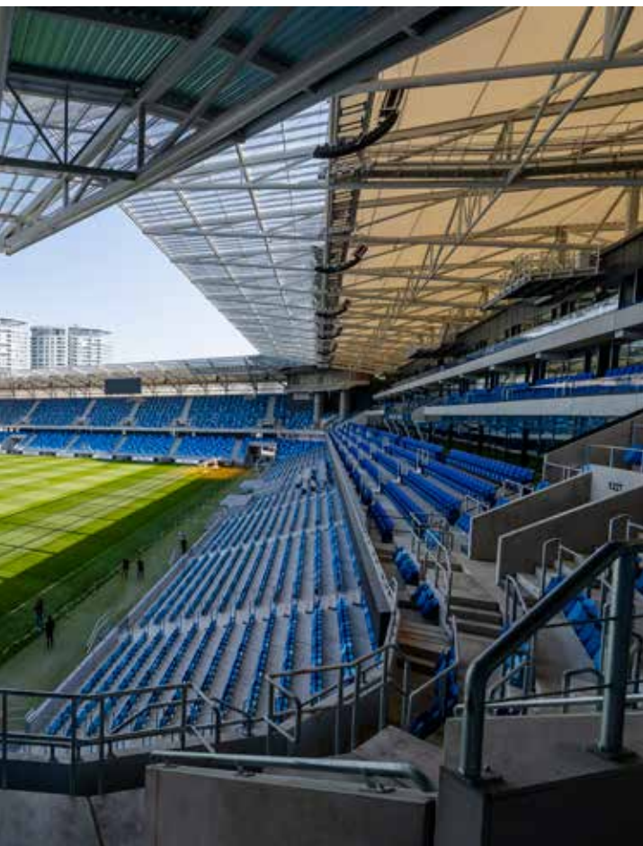
FOTO. Novostavba stojí na mieste pôvodného štadióna, na ktorom počas jeho slávnej histórie hrali nielen najlepší československí hráči, ale aj najlepšie mužstvá sveta.

sa použil nielen na stavbu športového areálu, ale aj na stavbu bytového domu (s výnimkou schodísk), administratívnej budovy i hotela.