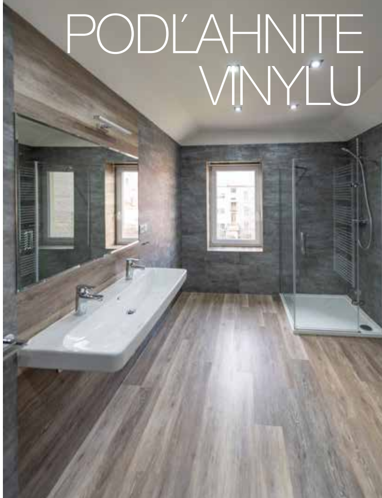
Vinylové dielce LVT možno spoľahlivo inštalovať aj v kúpeľniach vrátane sprchových kútov.