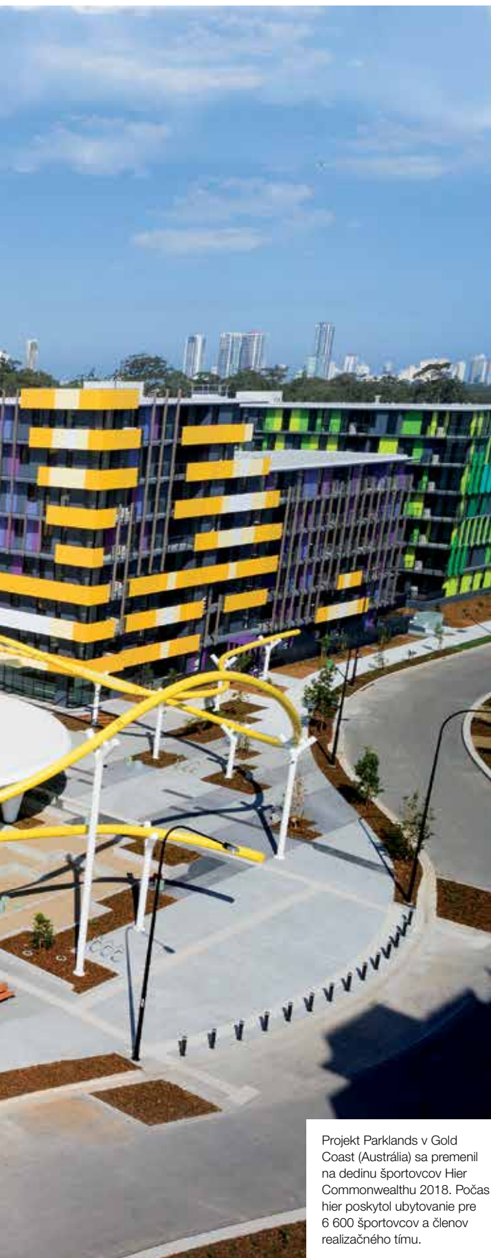
Projekt Parklands v Gold Coast (Austrália) sa premenil na dedinu športovcov Hier Commonwealthu 2018. Počas hier poskytol ubytovanie pre 6 600 športovcov a členov realizačného tímu.