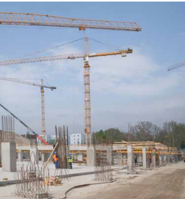
Výstavba základnej konštrukcie Národného futbalového štadióna